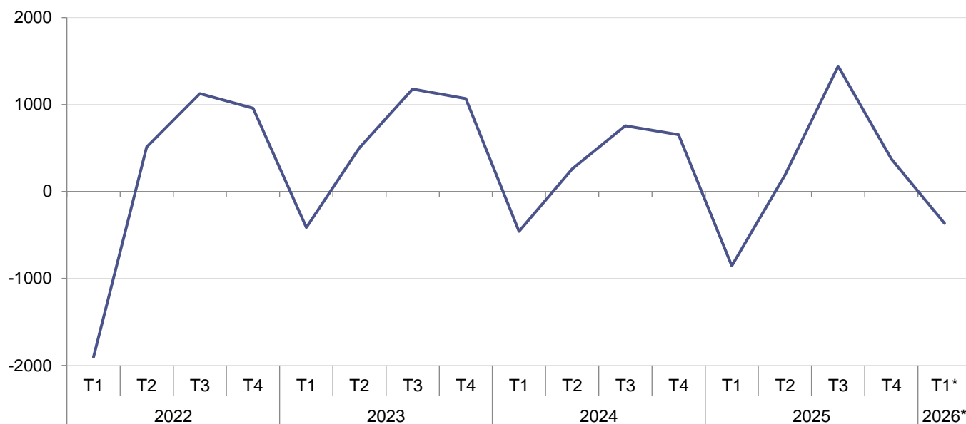
FIG. 1 SHTESA NATYRORE - TREMUJORE