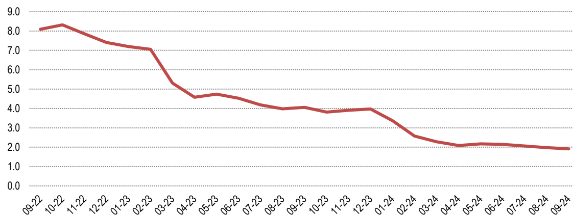
Fig. 1 Ndryshimet vjetore të Indeksit të çmimeve të konsumit (%)

Ndryshimi vjetor i indeksit të çmimeve të konsumit në muajin Shtator 2024 është 1,9 %, një vit më parë ky ndryshim ishte 4,1 %. Ndryshimi mujor i indeksit të çmimeve të konsumit në muajin Shtator 2024, krahasuar me Gusht 2024 është 0,6 %.