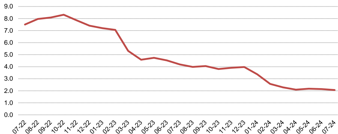
Fig. 1 Ndryshimet vjetore të Indeksit të çmimeve të konsumit (%)

Ndryshimi vjetor i indeksit të çmimeve të konsumit në muajin Korrik 2024 është 2,1 %, një vit më parë ky ndryshim ishte 4,2 %. Ndryshimi mujor i indeksit të çmimeve të konsumit në muajin Korrik 2024, krahasuar me Qershor 2024 është -0,2 %.