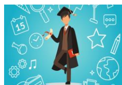
Popullsia me arsim të lartë