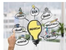
Inovatorët e produkteve