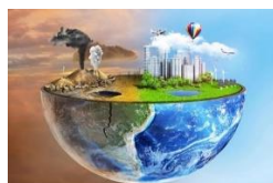
Teknologjitë e lidhura me mjedisin