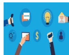
Shitjet e produkteve inovative