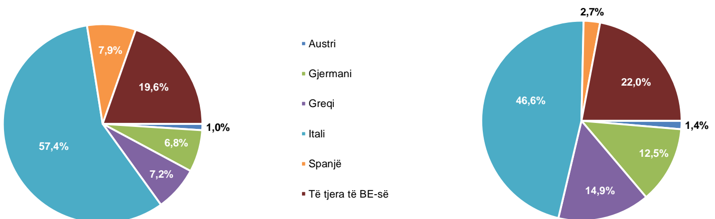
Fig. 4 Tregtia e jashtme e mallrave sipas disa vendeve të BE-së, Nëntor 2020

Gjatë këtij njëmbëdhjetëmujori, vendet me të cilët Shqipëria ka pasur rritje më të madhe të importeve, në krahasim me një vit më parë janë: Gjermania (0,3 %), Serbia (36,9 %) dhe Rusia (20,1 %). Ndërsa vendet me të cilat importet kanë pasur uljen më të madhe janë: Italia (9,7 %), Turqia (5,9 %) dhe Greqia (3,1 %).