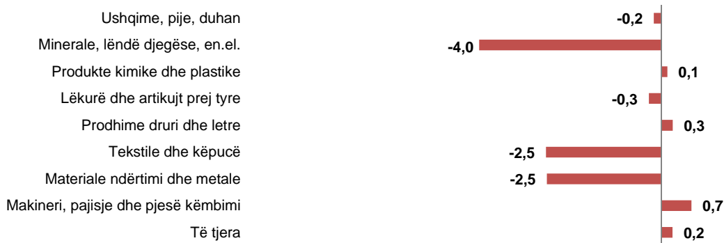
Fig.2 Kontributi i grupeve në ndryshimin vjetor të eksporteve, Maj 2019

Eksportet, gjatë këtij pesëmuajori janë ulur me -3,6 %, krahasuar me një vit më parë. Grupet që kanë ndikuar negativisht në uljen vjetore të eksporteve, janë: “Minerale, lëndë djegëse, energji elektrike” me -4,7 pikë përqindje, “Materiale ndërtimi dhe metale” me -1,6 pikë përqindje, “Tekstile dhe këpucë” me -0,8 pikë përqindje. Në ndryshimin vjetor të eksporteve ka ndikuar pozitivisht grupi: “Makineri, pajisje, pjesë këmbimi” me +1,6 pikë përqindje.