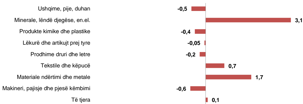
Fig.3 Kontributi i grupeve në ndryshimin vjetor të importeve, Maj 2019

Si pesëmujor, importet janë rritur me 3,4 %, krahasuar me pesëmujorin e parë 2018. Grupet që kanë ndikuar pozitivisht në rritjen vjetore të importeve, janë: “Minerale, lëndë djegëse, energji elektrike” me +2,9 pikë përqindje, “Materiale ndërtimi dhe metale” me +1,2 pikë përqindje, “Ushqime, pije, duhan” me +0,1 pikë përqindje. Në ndryshimin vjetor të importeve ka ndikuar negativisht grupi: “Makineri, pajisje, pjesë këmbimi” me -0,5 pikë përqindje.