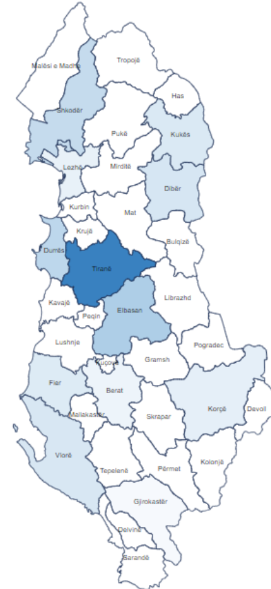
% of under-five mortality rate (per 1,000 live births)